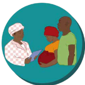
2. LES VISITES PRENATALES