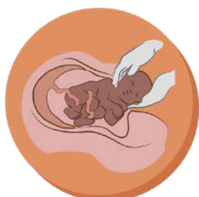
5. LA NAISSANCE