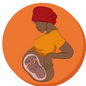
1. LA GROSSESSE