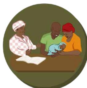
7. LES VISITES POSTNATALES