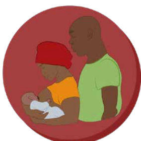
6. CHEZ NOUS APRÈS LA NAISSANCE