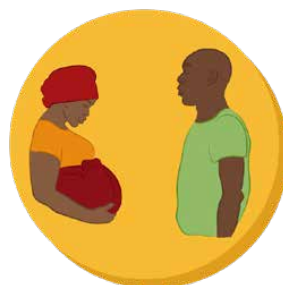
3. EN SANTE PENDANT LA GROSSESSE