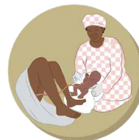
4. JE ME PREPARE A LA NAISSANCE